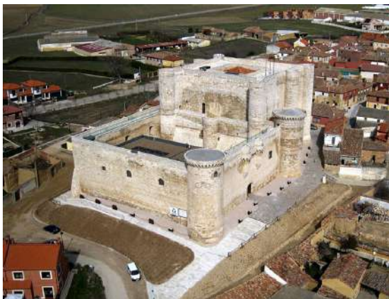
Castillo de los Sarmiento. Fuentes de Valdepero.