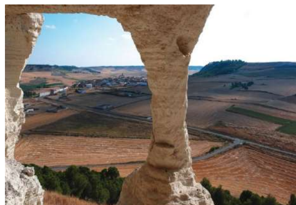
Puerta del Cerrato. Dueñas