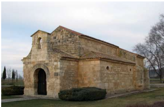
San Juan de Baños de Cerrato